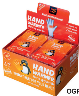
OGRZEWACZE DO RĄK zawiera: 40 szt. wymiały: 24 x 13 x 17 cm