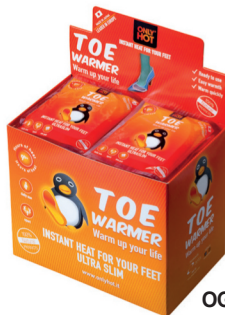
OGRZEWACZE DO PALCÓW zawiera: 40 szt. wymiały: 20 x 17 x 13 cm