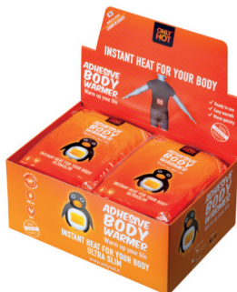
OGRZEWACZE UNIWERSALNE zawiera: 40 szt. wymiały: 24 x 13 x 17 cm