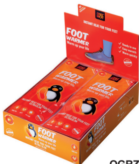
OGRZEWACZE DO STÓP zawiera: 24 szt. wymiały: 23 x 9 x 30 cm