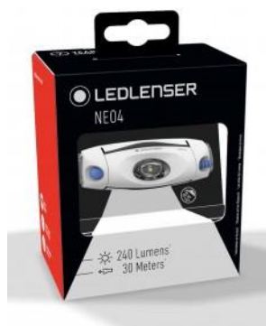
Przykładowe zdjęcie opakowania