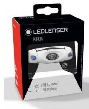
Przykładowe zdjęcie opakowania